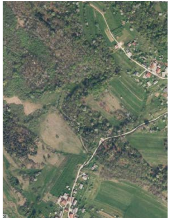
Lahinjski lugi, 2024

Ob pogledu na priloženi fotografiji iz let 1960 in 2024 lahko opazimo kar nekaj stvari. Leta 1960 je bilo območje ob reki Lahinji (Lahinjski lugi) redno košeno, prav tako je bilo redno vzdrževano celotno pobočje med reko Lahinjo in naseljem Knežina. V luči današnjega znanja o pomenu mozaične rabe prostora za biotsko pestrost bi lahko rekli, da je mogoče pred dobrimi 60 leti celo primanjkovalo zarasti. Danes pa lahko opazujemo popolnoma nasprotno situacijo. Že ob bežnem pogledu skozi okno ali pa na sprehodu po parku vidimo,