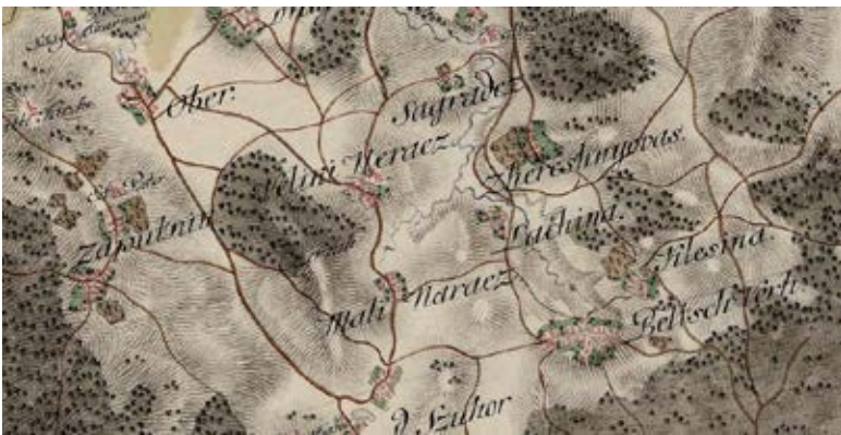
Slika a: Veliki Nerajec in sosednje vasi na zemljevidu s konca 18. stoletja (1784–1785)