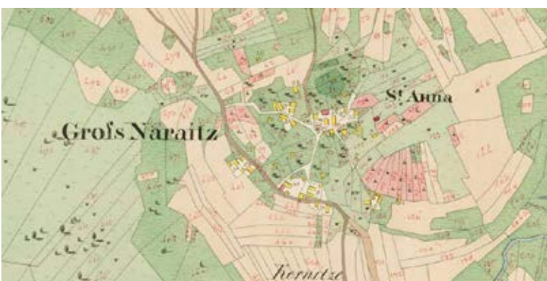
Slika c: Veliki Nerajec na katastru iz 19. stoletja