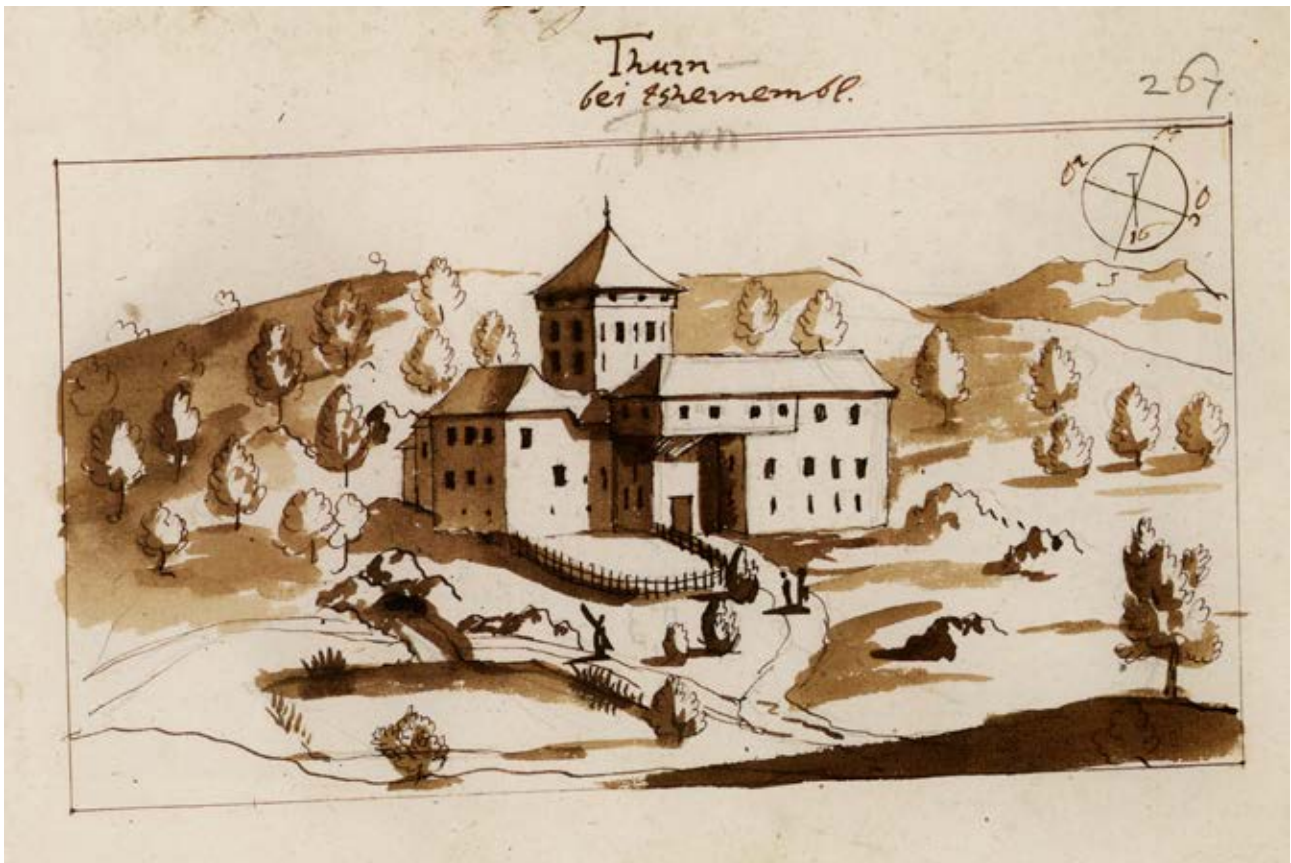
Grad Thurn bei Tschernembl, Turn pri Črnomlju, okoli leta 1675. Valvasor je grad upodobil ob obisku dežele nekje v sredini 70. let 17. stoletja. (Valvasor, Skicna knjiga)

Metlika. Kakor preostale dele Bele krajine so v prvi polovici 16. stoletja vpadi osmanskih jezdecev večkrat prizadeli tudi vasi okoli Dragatuškega polja. Ob vsakokratni grožnji in vpadu osmanske konjenice je grad služil kot utrdba, ki je sprejela svoje podložnike in njihovo premično premoženje. Valvasor je zelo splošno beležil: »V tej okolici (tj. okoli Breznika, op. a.) so Turki pogosto ropali, požigali, morili in se izkazali kot najgnusnejše živali in tiranski barbari.«