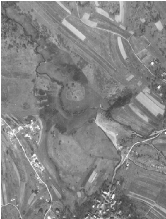
Lahinjski lugi, 1960

nekdanjih steljniških površin deloma v njive in travnike, deloma v gozd.