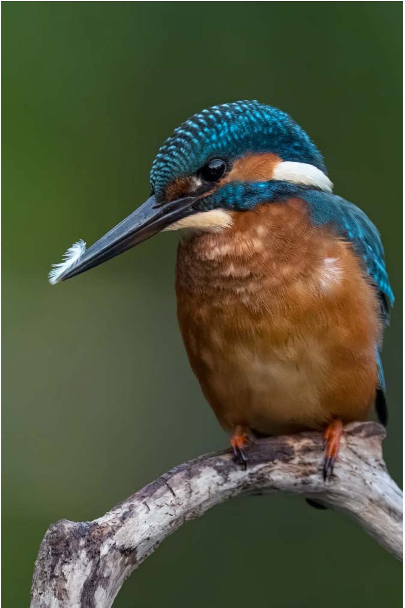
Št. 10, december 2025